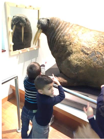
du morse pour l'Amérique