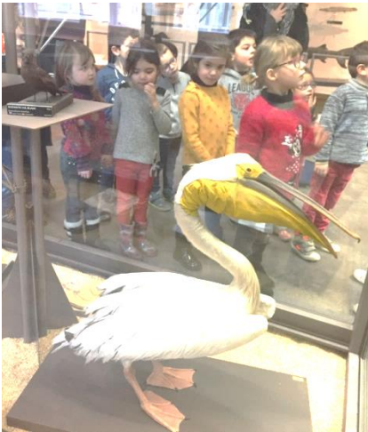
du pélican pour l'Asie

Ainsi, nous sommes partis à la découverte :