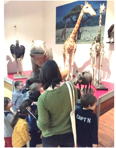
de la girafe pour l'Afrique